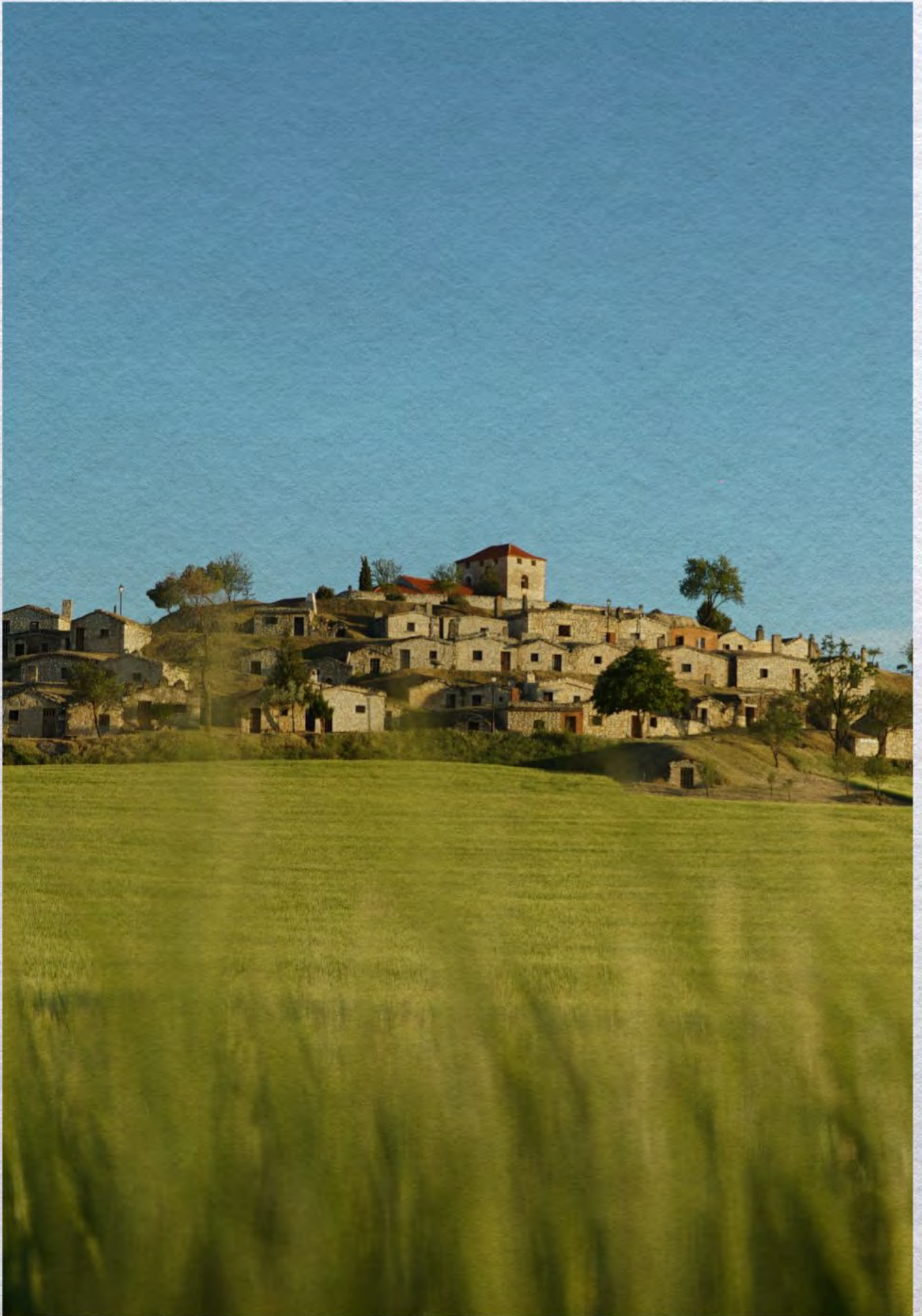
- D.O. Ribera del Duero -