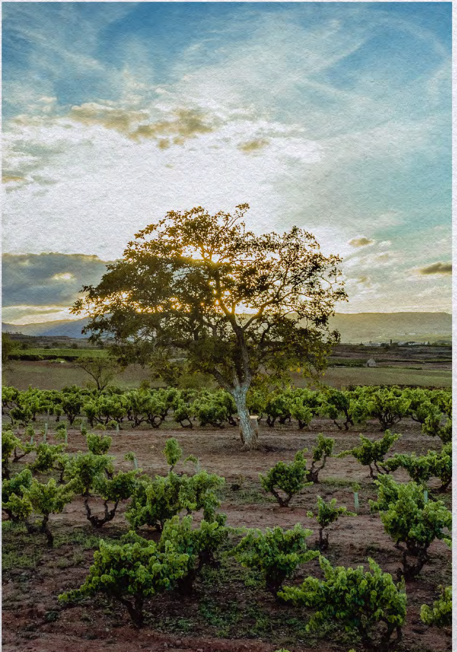
- D.O. Ca. Rioja -